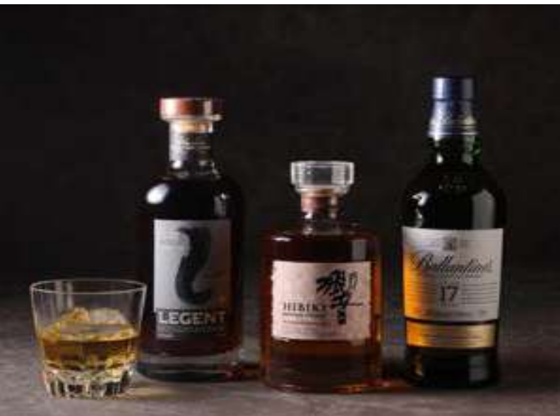
BALLNTINES 17yrs バラントイン17年