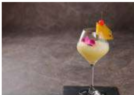
ピニャ・コラーダ PINE·COLADA