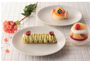
Home Made Cake 季節のホテル メイド ケーキ