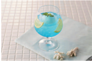
Blue Squash ブルースカッシュ