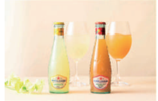
Fresh Orange Juice フレッシュ オレンジ ジュース