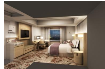
スーペリアルーム(一例)